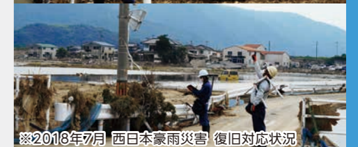
※2018年7月 西日本豪雨災害 復旧対応状況